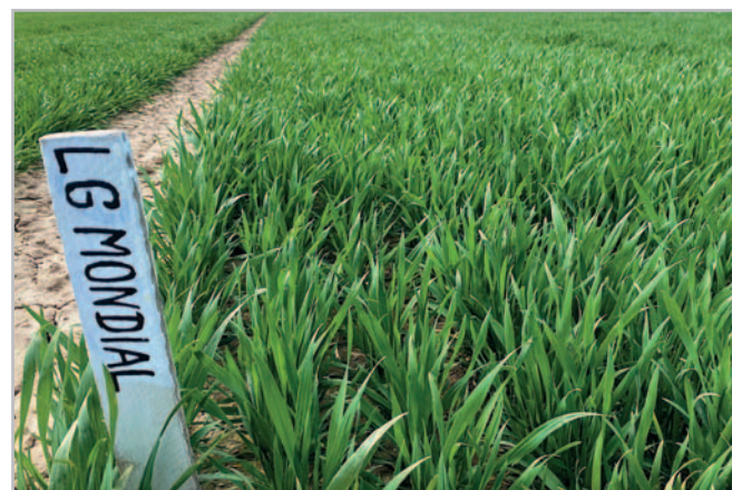
Pro odrůdu LG Mondial je typická krásně zelená barva a širší vzpřímené listy

ANO – LG Mondial má vynikající odolnosti proti poléhání. S hodnotou 7,9 bodu byl nejlépe hodnocenou odrůdou v celém zkoušeném souboru 2019–2021, čímž významně překonal i další nejlépe hodnocenou odrůdu v pořadí (Frisky) o osm desetín bodů!