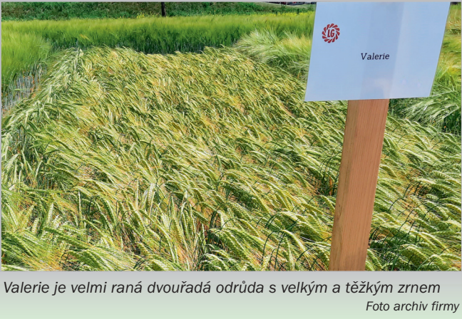
Valerie je velmi raná dvouřadá odrůda s velkým a těžkým zrnem

Na jaře byl porost přihnojen 150 kg stabilizované močoviny (Alzon), poté při 1. produkčním přihnojení 100 litry DAMu 390 a na závěr byl při druhém produkčním přihnojení dohnojen