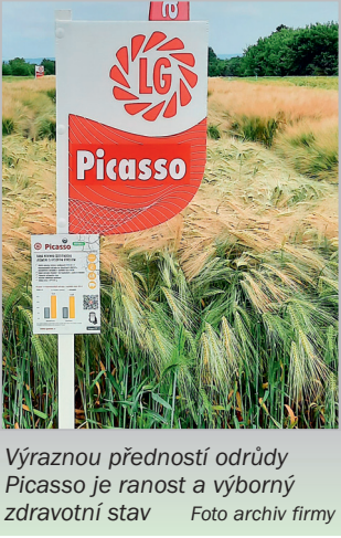
Výraznou předností odrůdy Picasso je ranost a výborný zdravotní stav