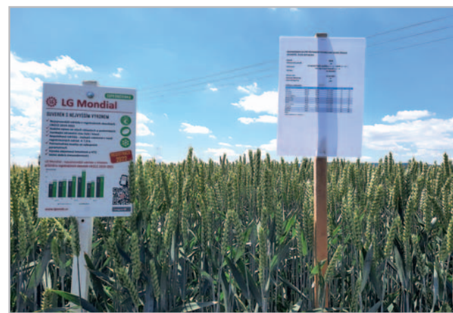
LG Mondial jsme zvolili také do soutěže pěstebních technologií v Kroměříži 2022

registračních zkoušek ÚKZÚZ 2019 až 2021. V tříletém cyklu zkoušek ÚKZÚZ 2019 až 2021 byly nově zkoušené odrůdy netradičně porovnávány pouze na „céčkové“ kontroly, a to Frisky a Johnson. Lačka byla tedy nastavena opravdu vysoko. Přesto