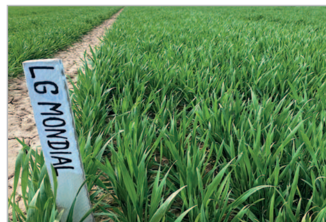
LG Mondial v raných fázích poznáte podle typické krásně zelené barvy a širších vzpřímených listů (Hněčevy 22. 4. 2022)

LG Mondial byl ÚKZÚZ registrován jako krmná, resp. nepotravinářská pšenice (má slabší pekařské parametry – těsto méně kyne), přesto dosáhl v registračních zkouškách ÚKZÚZ potravinářské kvality ve všech hlavních výkupních parametrech potravinářské pšenice. Objemová hmotnost, pádové číslo, Zelenyho test i obsah NL splnily požadavky na chlebovou pšenici, v některých případech i elitní pšenici. Dá se tedy pěstovat pro univerzální použití, čistě jako krmná odrůda