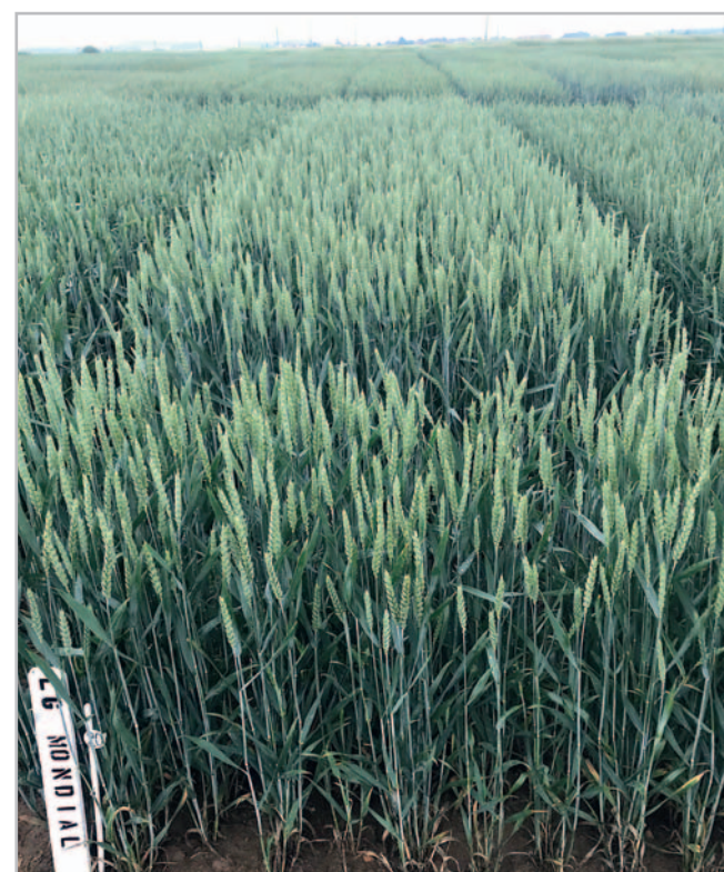
Pro odrůdu LG Mondial je po vymetání charakteristické ojínění a široký praporcový list, podobně jako má odrůda Frisky (ÚKZÚZ, Jaroměřice nad Rokytou 10. 6. 2022)

ideálně s nižšími vstupy, nebo jako velmi výnosná doplňková potravinářská pšenice.