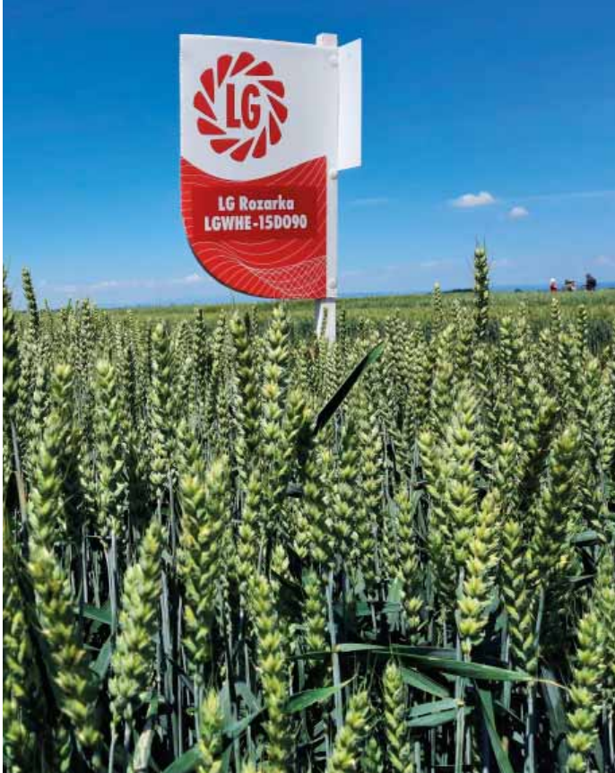
LG Rozarka je raná, výnosná odrůda, která dostala jméno podle sovy Rozárky z pohádky Tři oříšky pro Popelku

I když jsem sliboval, že nebudeme hovořit o nadpřirozených vlastnostech, přeci jen dvě „superschopnosti“ LG Rozarka má. Je totiž rezistentní proti larvám plodomorky plevové díky genu Sm1 a disponuje zvýšenou odolností k WSSMV (Virová čárkovitá mozaika pšenice), kterou přenášejí roztoči Aceria to-