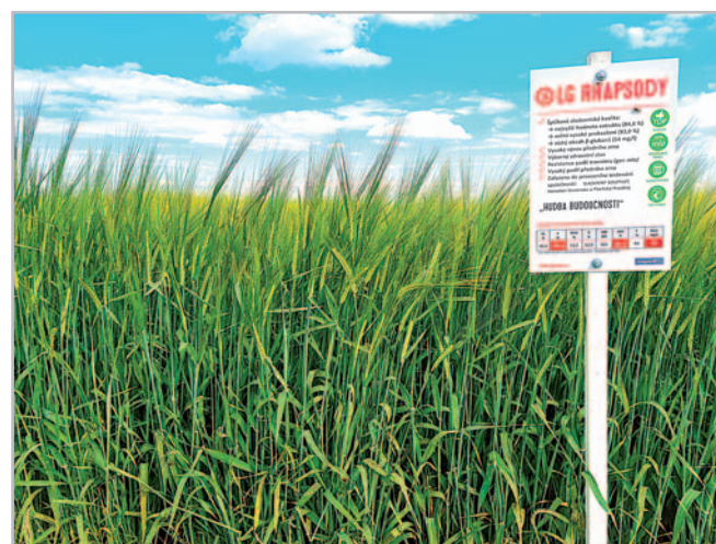
LG Rhapsody byla k vidění již na několika polních dnech v uplynulém roce – fotografováno 13. 6. 2024 na polním dni firmy Limagrain ČR v Hrubčicích

V podniku ZP Otice, a. s., (okres Opava) množili odrůdu