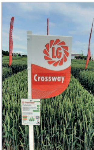
Crossway je typická svojí zelenou barvou a širokými listy, foto z PD Hrubčice Foto archiv firmy

Crossway je polopozdní odrůda s velmi dobrou odnoživostí. Je vhodná do všech výrobních oblastí. Registrována byla v ČR i v SR v roce 2021. V registračních zkouškách ÚKZÚZ 2018 až 2020 dosáhla nejvyššího výnosu z odrůd s kvalitou A v KVO a v ošetřené variantě a v ŘVO a BVO v obou variantách pěstování. Špičkový výnos potvrdily i následné zkoušky pro doporučení odrůd, kde obhájila pozici