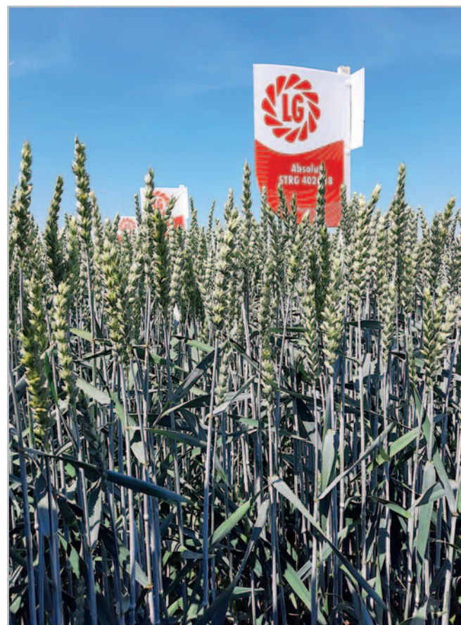
Odrůda pšenice ozimé Absolut je typická vyššími rostlinami, se silným stéblem, dlouhým vzdušným klasem a stříbřitou barvou rostlin

Ing. Stanislav Doležal Limagrain Česká republika, s. r. o.