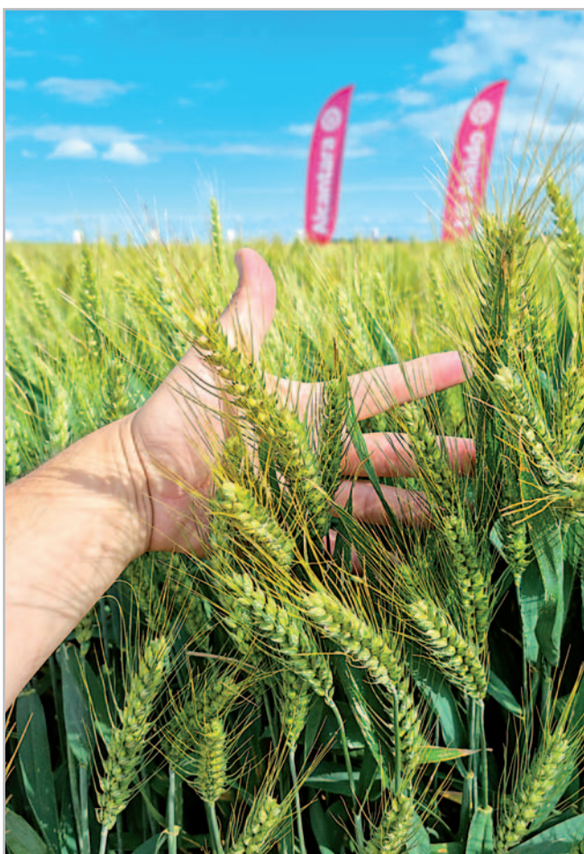
LG Aikido bylo možné vidět na řadě polních dnů, kde vzbudilo hodně pozornosti, fotografie je z Polního dne Hrubčice 13. 6. 2024

LG Aikido disponuje velmi dobrou potravinářskou kvalitou jak v základních mlynářských parametrech, tak i v těch pekařských. Předností je vysoká OH, velmi vysoké pádové číslo, velmi dobrý obsah NL i lepku a vysoká sedimentační hodnota stanovená Zeleného testem. Dvouletý průměr hodnot 2022 a 2023 ve