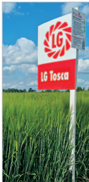
LG Tosca je relativně raná velmi výnosná a zdravá sladovnická odrůda jarního ječmene

větších zpracovatelů ječmene v ČR a SR poptávají odrůdu LG Tosca také další odběratelé, jako jsou: Plzeňský Prazdroj, a. s., (v ČR i na Slovensku), ČESKOMORAVSKÉ SLADOVNY, a. s., MSK Kroměříž a. s., SLADOV-