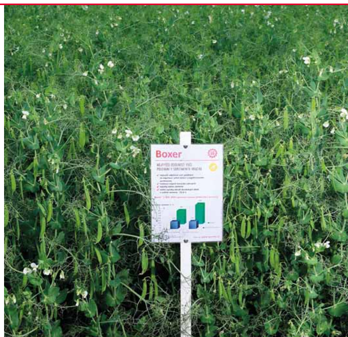
Boxer má najvyššiu odolnosť proti poliehaniu

Niektorí pestovatelia využívajú Boxer pre jeho kratšiu lodyhu a výbornú odolnosť voči poliehaniu tiež ako kryciu plodinu pre zakladanie nových porastov krmovín. U Boxeru totiž dochádza iba k minimálnemu poľahnutiu porastu . Taký porast prepúšťa podsiatej plodine dostatok svetla a zároveň ju nepoškodzuje poľahnutím.