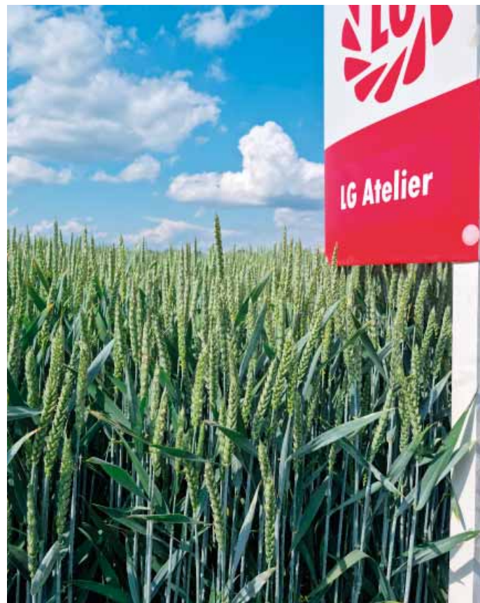
LG Atelier je pozdní odrůdou s výbornou potravinářskou kvalitou, vysokou odnoživostí a výborným zdravotním stavem včetně rezistence proti pravému stéblolamu ( Pch1 )

i výsledky v jednotlivých ročních registračních zkouškách na ÚKZÚZ nebo i zkoušky německého BSA. Předností odrůdy je vysoký obsah NL, vysoká hodnota ZT, vysoká OH, vysoké a stabilní ČP a výborné pekařské parametry. Přestože byla tato odrůda registrována „pouze“ s kvalitní potravinářskou jakostí A, dosahuje nadstandardní kvality blíže kvalitě E. Díky