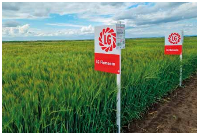
Odrůdy LG Flamenco a LG Belcanto patří v současnosti k nejvýnosnějším jarním ječmenům na trhu, obě jsou vhodné na krmení nebo potravinářské využití

V registračních zkouškách ÚKZÚZ sice prokázala výběrovou sladovnickou kvalitu (USJ 7,3 b.), ale sladovny daly přednost ještě o něco jakostnějším odrůdám jako jsou LG Tosca nebo LG Rhapsody. LG Flamenco tudíž nachází využití jako top výnosná nesladovnická a krmná odrůda, je vhodná jak pro výrobu vloček, krup, tak i na krmení. Dosahuje velmi dobré HTZ na úrovni 49 g a vysokého podílu předního zrna. Odrůda je středně raná s relativně nízkými rostlinami (délka stébla cca 67 cm, což je o 4 cm méně než je průměr zkoušeného souboru). Předností je také vysoká