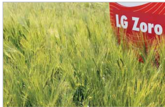
LG Zoro se podle množství certifikovaných osiv na podzim 2021 stalo již 3. nejpěstovanější odrůdou ozimého ječmene v ČR

LG Zoro dostala standardní ošetření fungicidy, které zahrnuje i ošetření osiva přípravkem Systiva. Po upozornění na vyšší délku stébla byly porosty kráceny ve dvou fázích, a to přípravkem Moddus v plné dávce a následně úč. l. ethephon (0,5 l/ha), což se vyplatilo a porosty stály až do sklizně. Ing. Lapčík si na odrůdě cení výborného zdravotního stavu, který je podpořen rezistencí proti virové zakrslosti ječmene (BYDV). Lze tak vynechat podzimní insekticidní ošetření, a tím se tato odrůda stává z pěstitelského pohledu podstatně jednodušší.