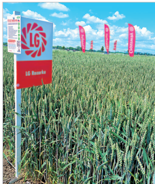
LG Rozarka je velmi raná, výnosná odrůda s velmi dobrou potravinářskou kvalitou A