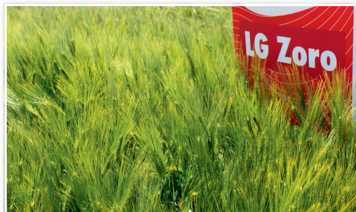
LG Zoro se podle množství certifikovaných osiv na podzim 2022 stal již 3. nepěstovanější odrůdou ozimého ječmene v ČR

LG Zoro je středně raná, plastická odrůda s velmi dobrou zimovzdorností, vhodná do všech výrobních oblastí. Je možné ji pěstovat i po obilníně. Odrůda má střední odnoživost. Doporučený výsev se pohybuje v rozmezí 3,5 až 4,5 MKS/ha, podle oblasti a termínu setí. Cílová hustota porostu je 600 až 650 klasů na metr