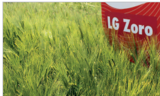
LG Zoro se podle množství certifikovaných osiv na podzim 2021 stalo již 3. nepěstovanější odrůdou ozimého ječmene v ČR

LG Zoro je středně raná, plastická odrůda s velmi dobrou zimovzdorností, vhodná do všech výrobních oblastí. Je možné ji pěstovat i po obilnině. Odrůda má střední odnoživost. Doporučený výsev se pohybuje v roz-