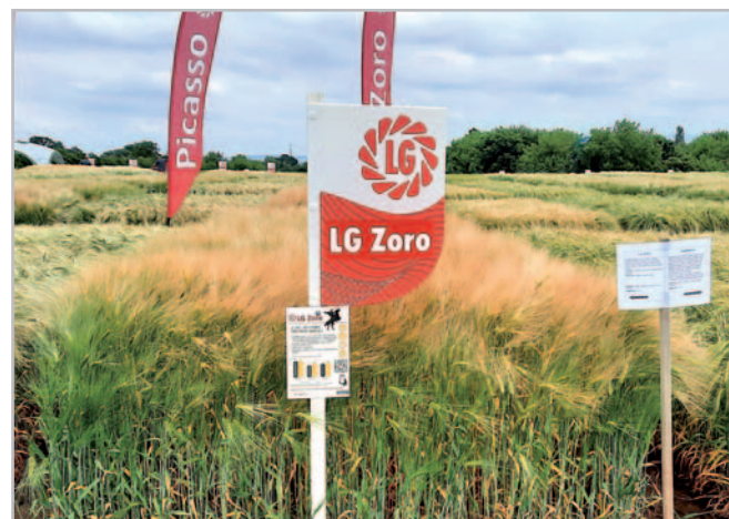
LG Zoro dosáhl v demonstračním pokuse v Kroměříži vynikajícího výnosu 11,61 t/ha

Odrůda má střední odolnost proti poléhání a relativně těžký klas. Z tohoto důvodu doporučujeme při intenzivním způsobu pěstování aplikovat střední až vyšší dávku regulátoru růstu na zkrácení a zpevnění stébla. LG Zoro se vyplatí pěstovat intenzivním způsobem s aplikací fungicidu proti základním cho-