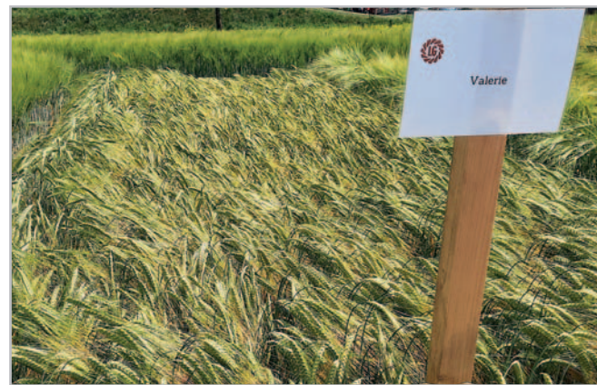
Valerie je velmi raná dvouřadá odrůda s velkým a těžkým zrnem.

Picasso je raná víceřadá odrůda ozimého ječmene, která dosáhla vynikajících výnosů v ošetřené i neošetřené variantě registračních zkoušek ÚKZÚZ. Je vhodná pro intenzivní pěstební podmínky, ale i do teplejších a sušších oblastí nebo pro extenzivnější hospodaření. V suchém roce 2019 bylo Picasso vůbec nejvýnosnější odrůdou daného ročníku ve zkouškách ÚKZÚZ. Vysoký výnos potvrzuje také ně-