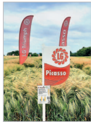
Výraznou předností odrůdy Picasso je ranost a výborný zdravotní stav.

Velkou předností Valerie je velké a těžké zrnko, které dosahuje HTZ mezi 50–55 g, v dobrých podmínkách i 60 g! Díky tomu dosahuje nejvyšší objemové hmotnosti zrna z celého sortimentu ozimých ječmenů v SDO, ve čtyřletém průměru (2018 až 2021), který zahrnuje i suché roky, je to 675 g/l. Zrno této odrůdy má také vysoký obsah škrobu (60,3 %) a velmi vysoký podíl předního zrna 94 %. Zrno odrůdy Valerie je mimořádně vhodné