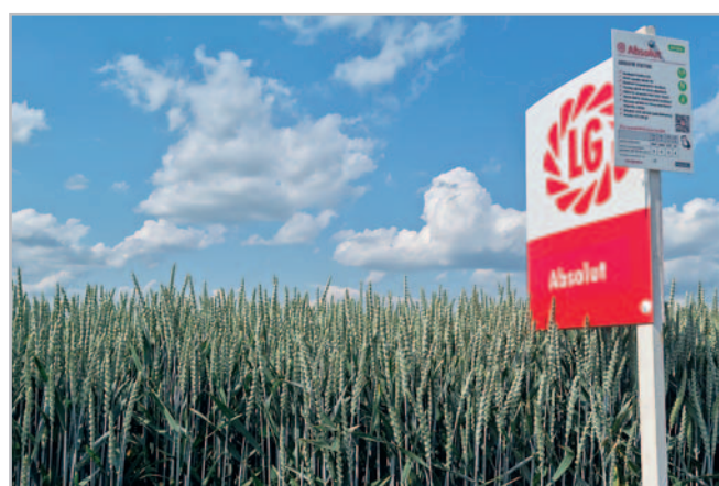
Absolut je středně raná odrůda pšenice s výbornou potravinářskou kvalitou na úrovni E pšenice. Je typická vyššími rostlinami, se silným stéblem, dlouhým vzdušným klasem a stříbřitou barvou rostlin

m 2 ). Dominantním výnosotvorným prvkem je hmotnost zrna, tedy vysoká HTZ a vysoká OH.