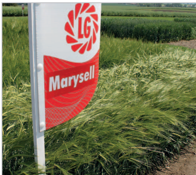
Marysell splnila náročná provozní zkoušky společnosti Heineken v Hurbanove

ře jak po sladovnické kvalitě, tak i v pivovarnické zkoušce a i po pěstitelské stránce. Díky tomu byla na podzim 2022 zařazená na zelenou listinu schválených