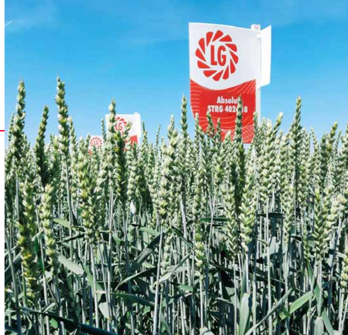
Pro Absolut je typický dlouhý vzdušný klas a stříbřitě ojněné rostliny