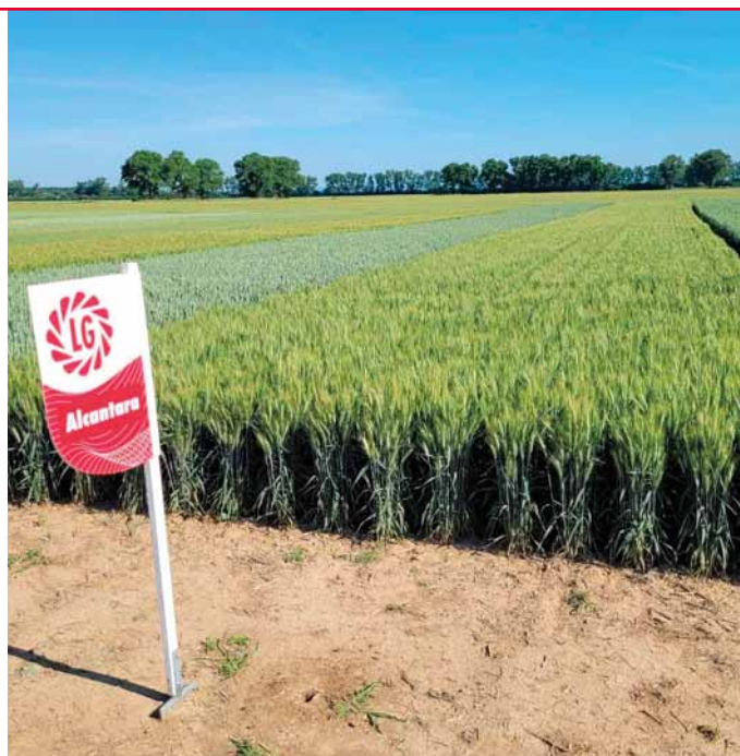
Alcantara má velký osinatý klas a zrno s vysokou HTZ