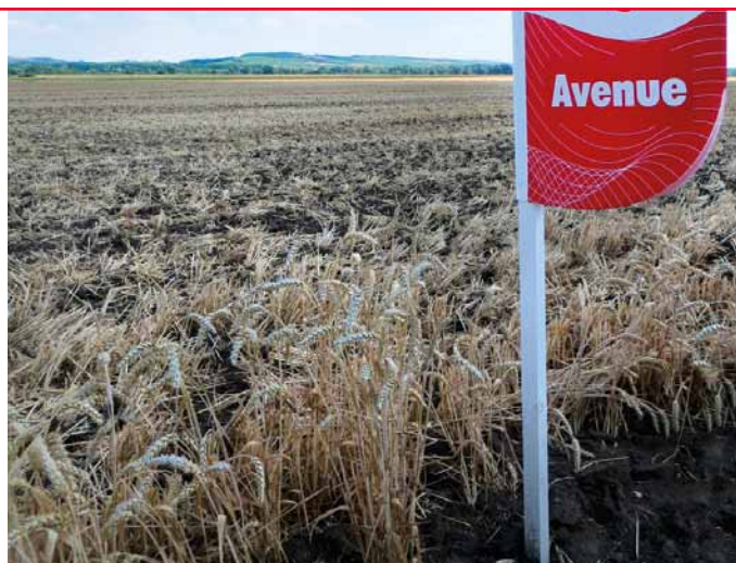
První sklizená pšenice