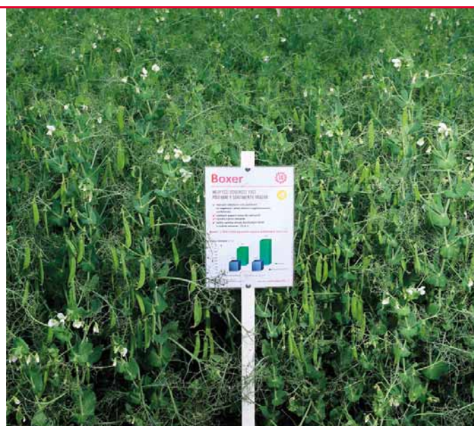
Boxer má nejlepší odolnost proti poléhání (7 b.)

Boxer je žlutosemenná středně raná odrůda úponkového hrachu (typ semi-leafless). Má středně dlouhé až kratší rostliny a nejvyšší odolnost proti poléhání za vegetace