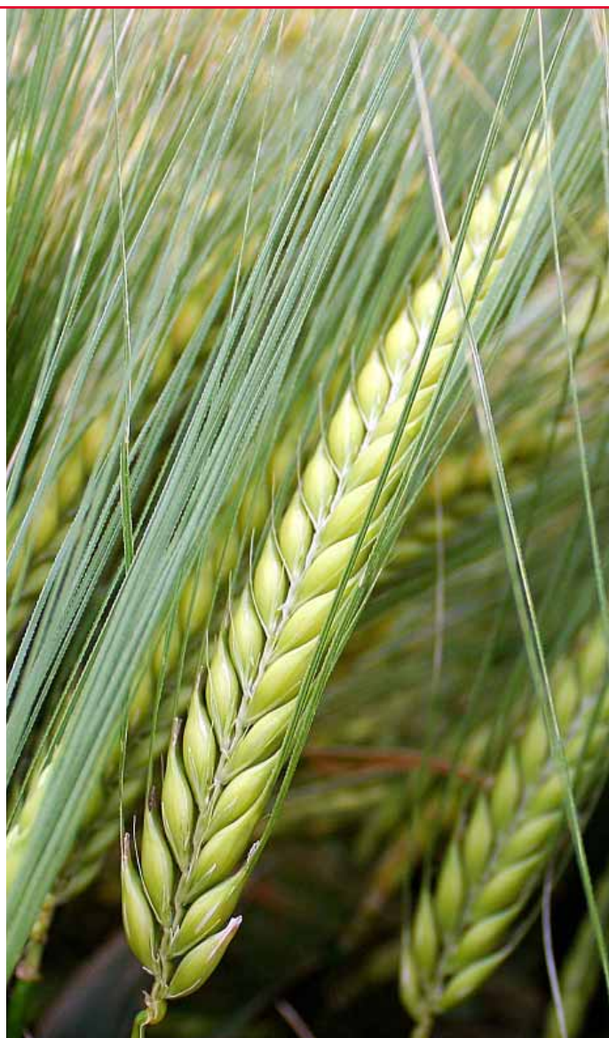
Leopard - odrůda s dlouhým produktivním klasem

Poznámka: Výnos v % je vztažen na průměr kontrolních odrůd Leopard a Padura, čtyřletý průměr 2016–2019