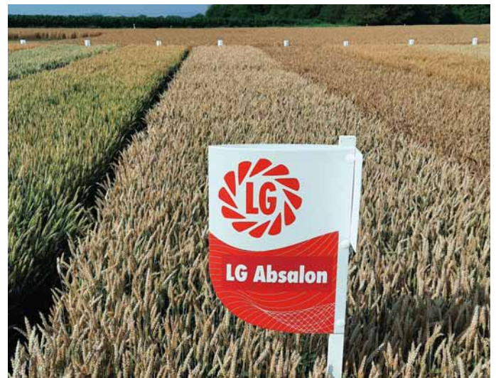
LG Absalon je raná odrůda, vlevo Frisky a vpravo Avenue (foceno 13. 7. 2021)

(*polní pokusy firmy Agrotest fyto, s.r.o. 2021)