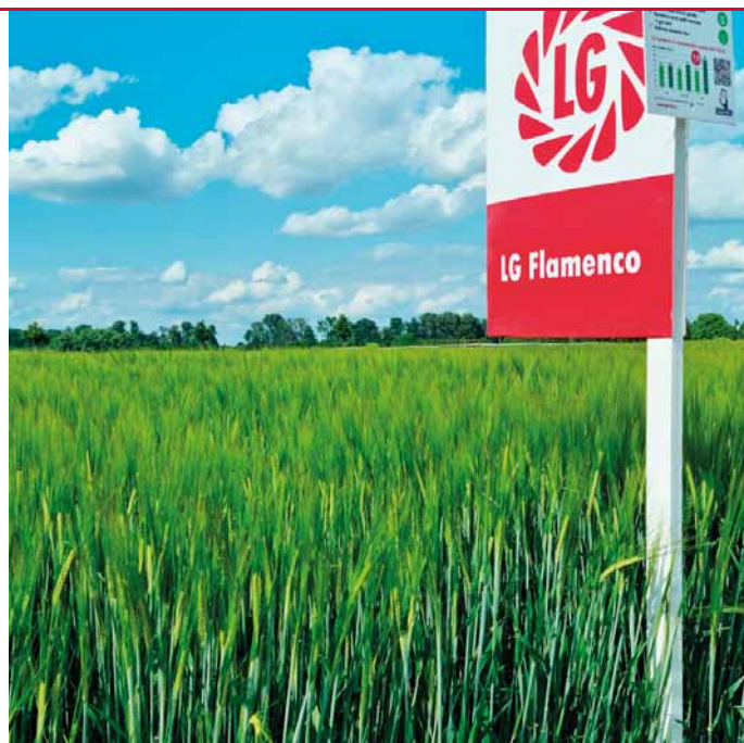
LG Flamenco je v současnosti nejvýnosnější registrovaná odrůda ječmene v ČR

I KDYŽ SE JEDNÁ O HORKOU NOVINKU, OSIVO VE STUPNI C1 BUDE DOSTUPNÉ JIŽ PRO JARO 2024!