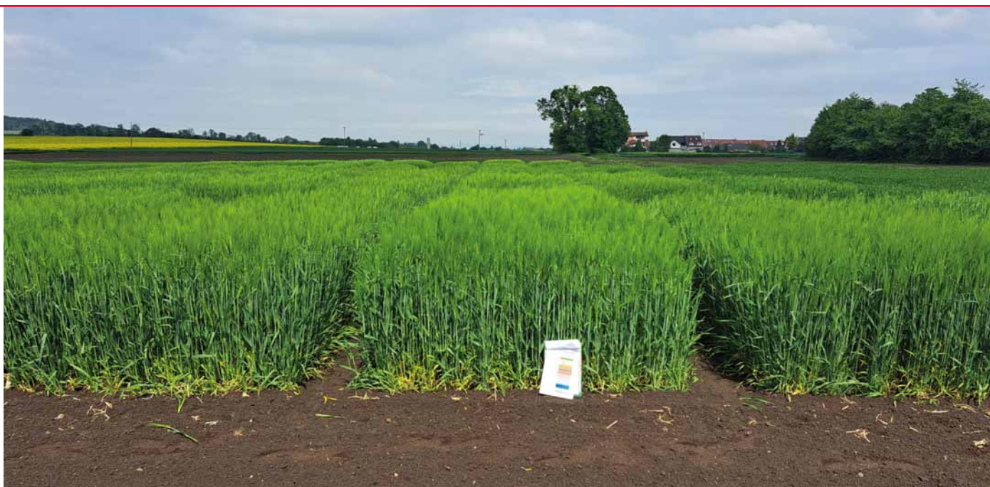
LG Korok (parcela uprostřed) byl k vidění také o Polním dnu Kroměříž v pokusech Zemědělského výzkumného ústavu, kde v demonstračním maloparcelkovém pokusu s odrůdami ozimého ječmene dosáhl již v extenzivní variantě pěstování výnosu 13,85 t/ha. V intenzivní variantě to bylo dokonce 15,51 t/ha.