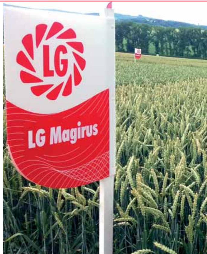
LG Magirus se vyznačuje velmi vysokou HTZ

Zdroj: Beschreibende Sortenliste 2020, BSA Německo, přehled odrůd 2020; srovnání odrůd kvality E pěstovaných také v ČR; hodnocení: 9 - nejvyšší výnos, 1 - nejnižší výnos