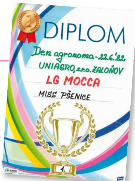
Miss pšenice ozimá 2022 - Den agronoma 22.6.2022 UNIAGRO Zaloňov