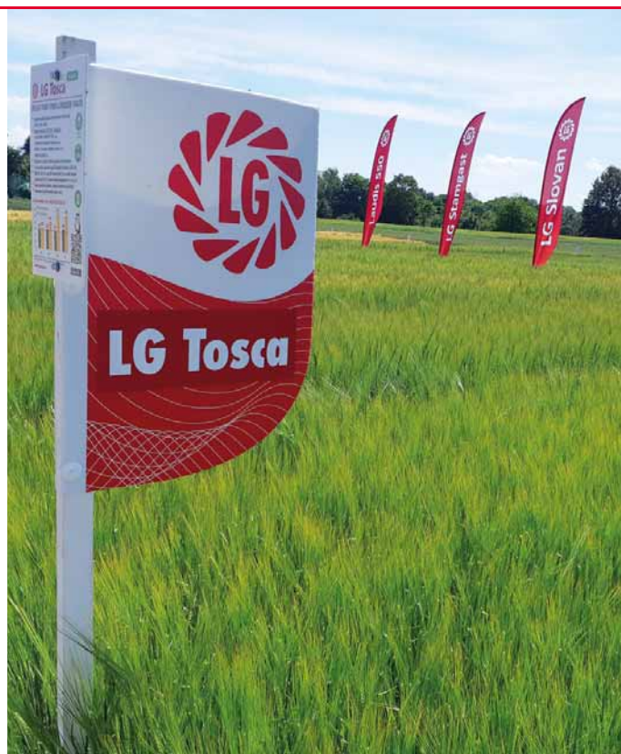
Odrůda LG Tosca je raná, velmi výnosná sladovnická odrůda