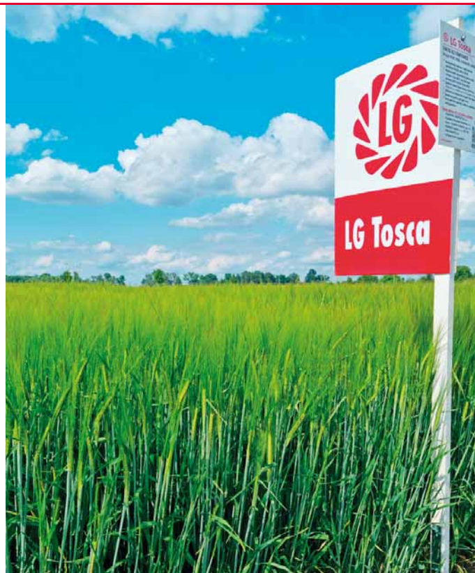
Odrůda LG Tosca je raná velmi výnosná sladovnická odrůda