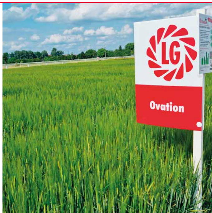
Ovation je oblíbený krmný ječmen s vysokou HTZ a velkým zrnem