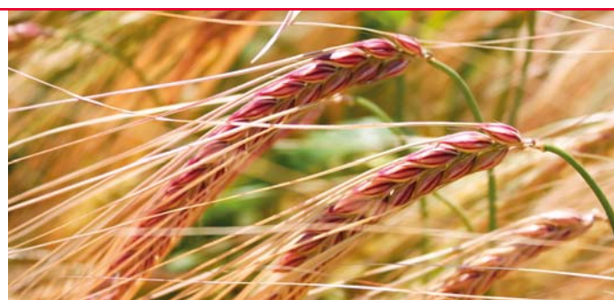
Padura - odrůda s nezaměnitelným klasem

Vysvětlivky: Nízký/á ██████████ Nízký/á-střední ██████████ Střední ██████████ Vysoký/á ██████████ Velmi vysoký/á ██████████