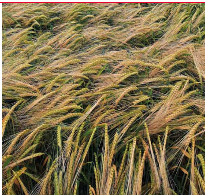
Padura tvoří porosty plné klasů s velkým zrnem