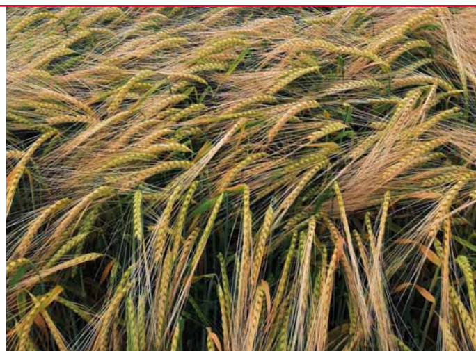
Padura tvoří porosty plné klasů s velkým zrnem

Padura vyniká velmi dobrým zdravotním stavem a vysokou odolností proti poléhání. Má velmi dobrou odolnost proti padlí travnímu, rzi ječné i hnědé skvrnitosti. Předností je také odolnost rynchosporiové skvrnitosti a fuzariózám v klasu.