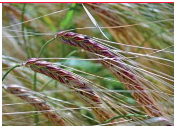
Padura a její typické antokyanové zbarvení klasu