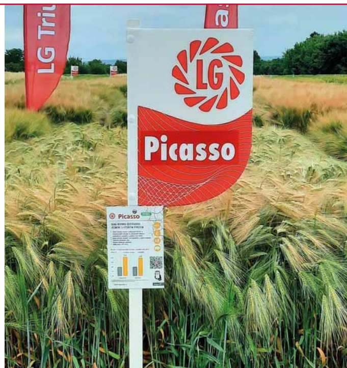
Výraznou předností odrůdy Picasso je ranost a výborný zdravotní stav

Zdroj: ÚKZÚZ SDO 2023 - Ječmen ozimý, průměr 2019–2022; výnos v % je uveden na průměr kontrolních odrůd KWS Kosmos, Beckenbauer, LG Zoro v neošetřené variantě pěstování; N - neošetřeno, O - ošetřeno